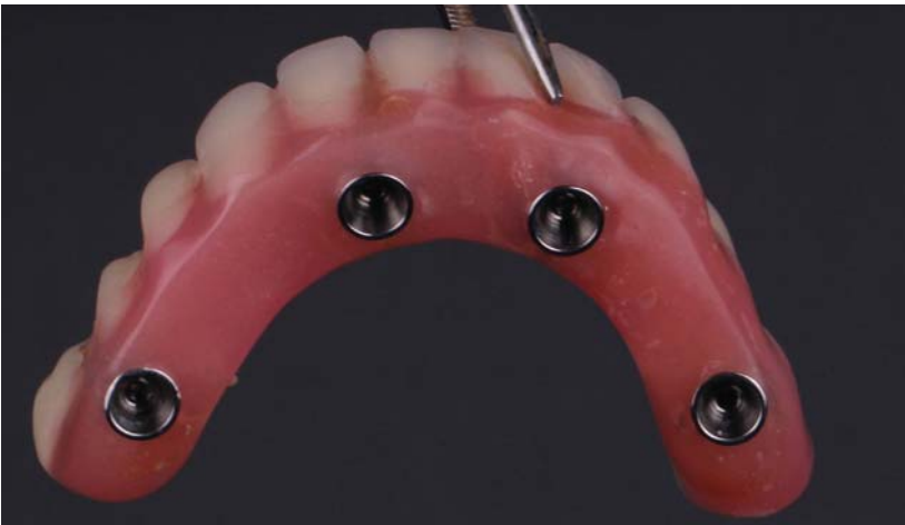
Resim 5 b.

abutmentler proteze adapte edilmiş; tesviye yapılarak abutmentların protez dışında kalan kısımları kesilmiş, aynı zamanda protezin doku yüzeyleri operasyon sahasını irrite etmeyecek şekilde dış bükey hale getirilerek cilalanmıştır (Resim 5a ve 5b).