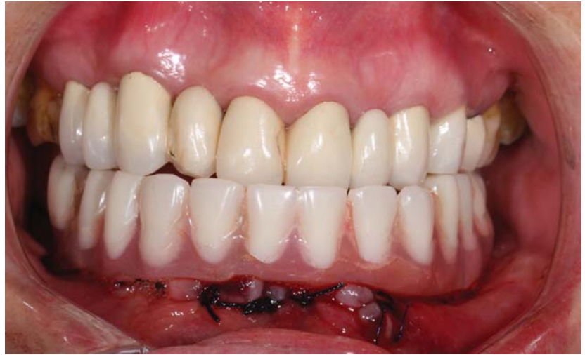
Resim 7 a.

lizde, dental implantların uygulanması sırasında 30 ile 50 Ncm arasında elde edilecek tork değerinin hemen yük-