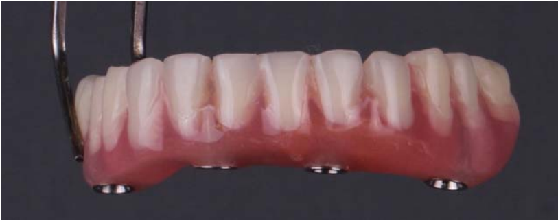
Resim 5 a.

vidalarının denk geldiği yerler tespit edilmiş ve bu bölgelerden delikler açılmıştır. Daha sonra kapama vidaları çıkarılarak multi base abutmentların üzerine geçici abutmentlar yerleştirilmiştir (Resim 4). Protez tekrar ağızda denenip abutmentlara temas etmemesi sağlanmıştır. Dikiş olan kısımlar izole edildikten sonra; otopolimerizan diakrilat kaide materyali (Qu Resin, Bredent, İngiltere) kullanılarak geçici