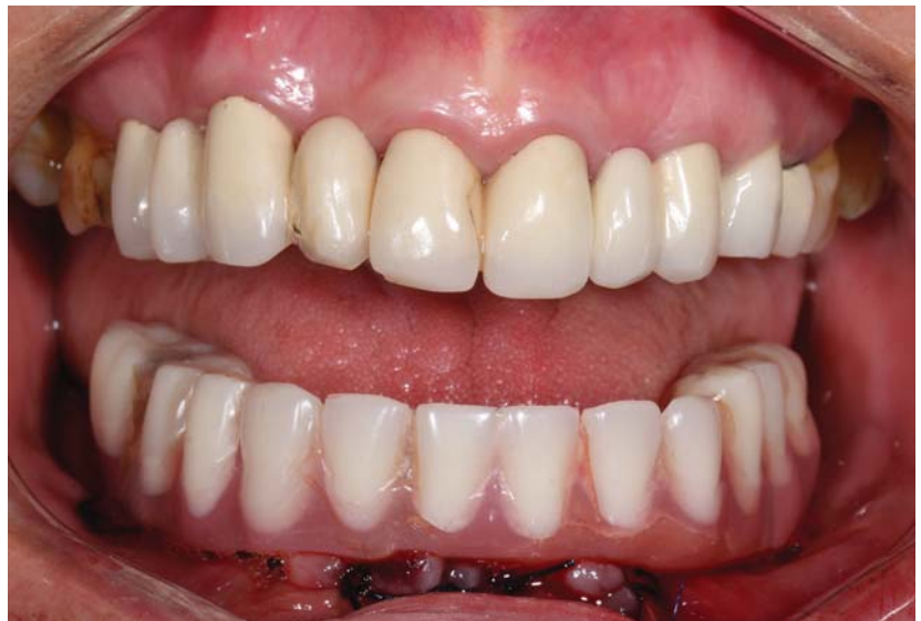
Resim 7 b.